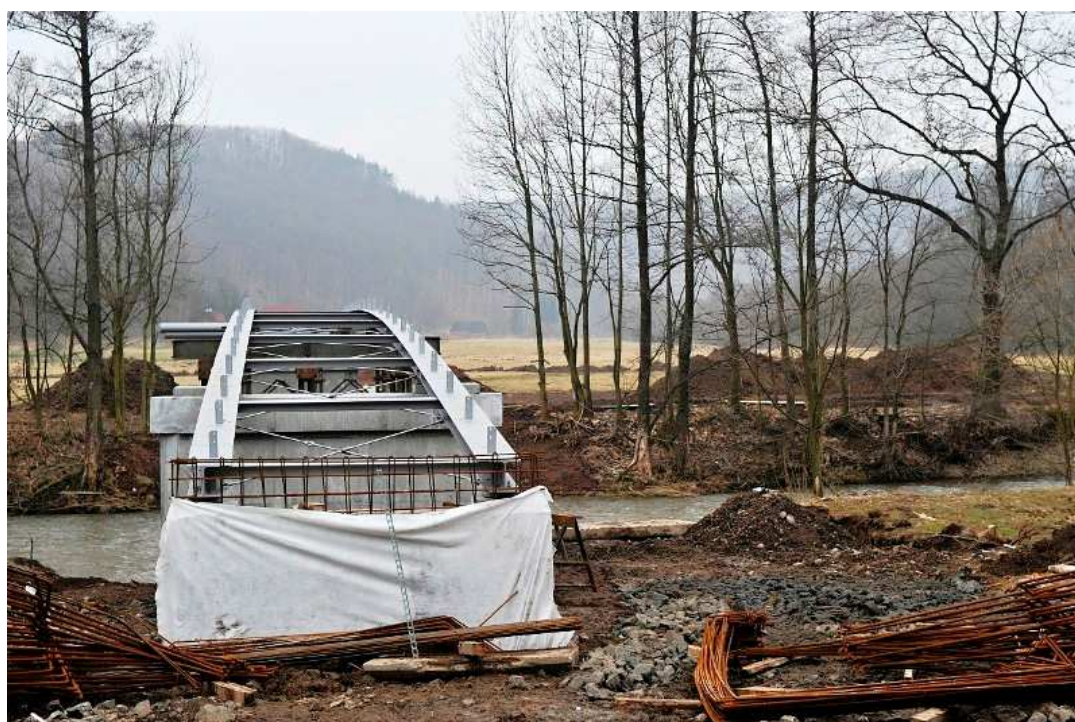
Stavba mostu Křížky - Rakousy