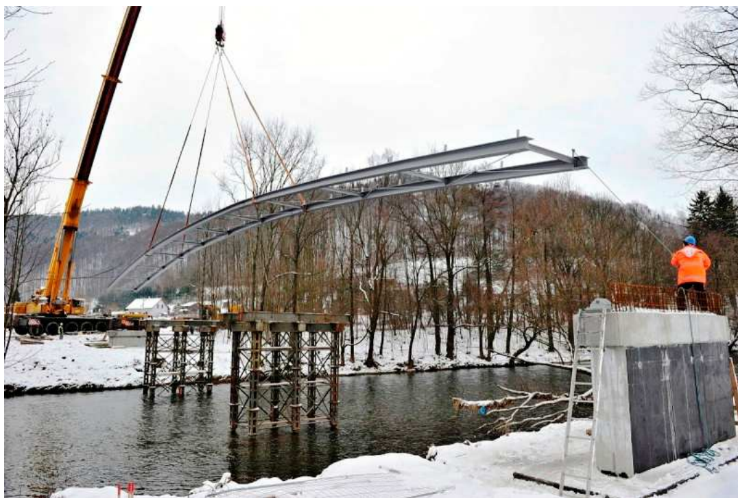
Pokládání mostu Křížky – Malá